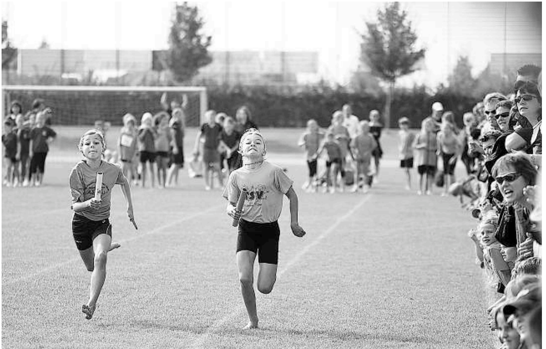
Mit letztem Einsatz: Zwei junge Sprinterinnen liefern sich an der Unionstafette in Jona ein spannendes Duell vor einer prächtigen Zuschauerkulisse.

In Gruppen aufgeteilt, absolvierten die Kinder und Jugendlichen während des ganzen Morgens ihre gewählten Disziplinen. Am Nachmittag standen als eigentlicher Höhepunkt der Veranstaltung die diversen Mannschaftswettkämpfe auf dem Programm. Grandioser Schlusspunkt bildeten die Unionstafetten. Die besten Läuferinnen und Läufer pro Kanton hatten sich zu Kantone-Mannschaften zusammengeschlossen und erkoren so den Kantone-Schweizer-Meister in den Pendellauf-Stafetten. Weil die