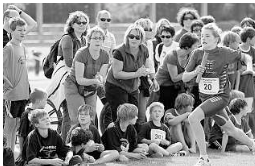
Hautnah dabei: Die Wettkämpfe werden von einer grossen Zuschauerkulisse verfolgt – die Stimmung ist einzigartig.