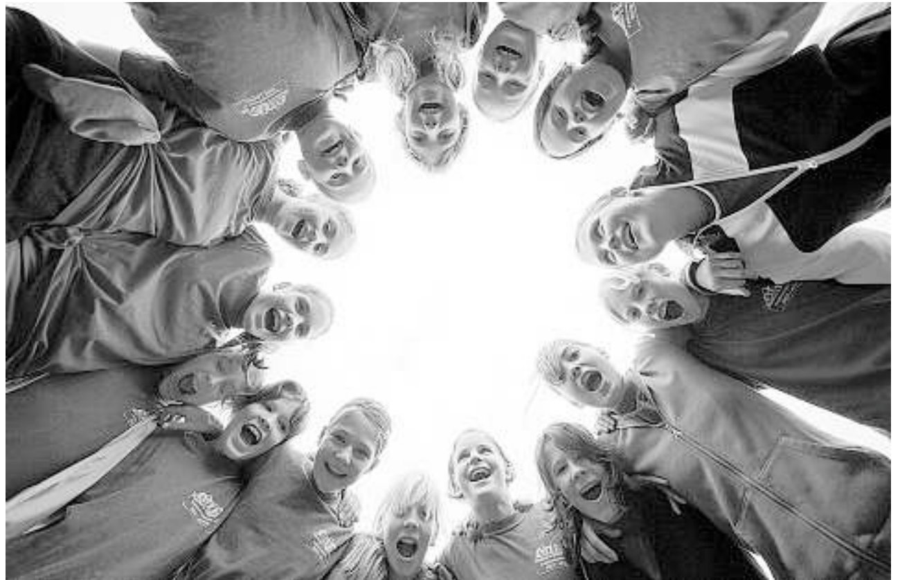
Als Team stark: Die Mädchenriege Altendorf stimmt sich auf den nationalen Jugifinal in Jona ein.